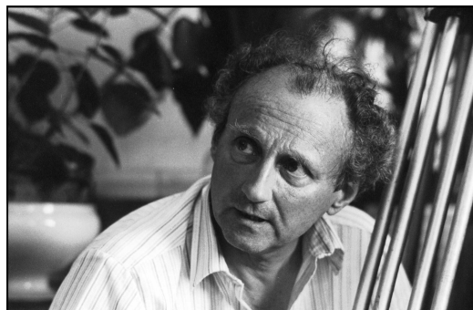
Cinamatek - Collection Delvaux Mécénat de la Banque Triodos