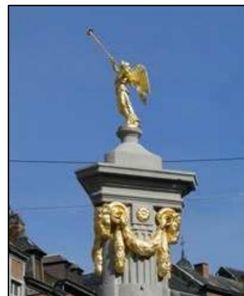
Fontein van de Engel in Namen Mecenaat van het ING Fonds