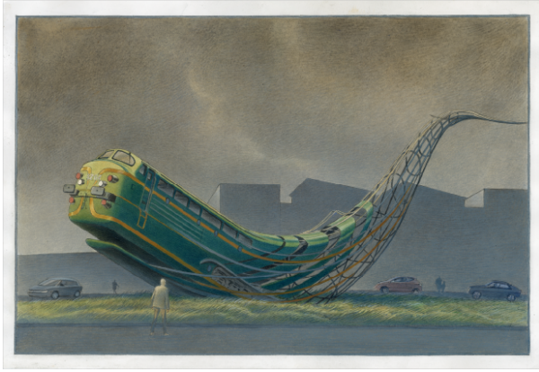
©Collection Train World Heritage – SNCB – François Schuiten - Sculpture ferroviaire